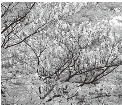
アカヤシオ、シロヤシオが咲く竜馬ヶ岳