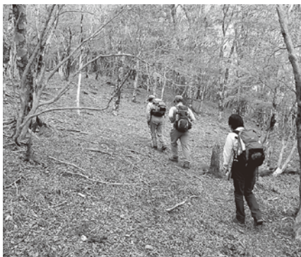
千里ヶ原の自然林を登る

分) 尾根取付点 (50分) 尾根横断地点 (40分) 岩岳山 (30分) 北峰 (40分) 竜馬ヶ岳 (30分) 岩岳山 (1時間10分) 玄馬沢林道終点 (20分) ゲート 2万5千圓 高郷 蕎麦粒山